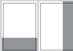
1/3 SEITE QUER ODER HOCH