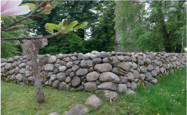
Bild 2: Findlingsmauerwerk